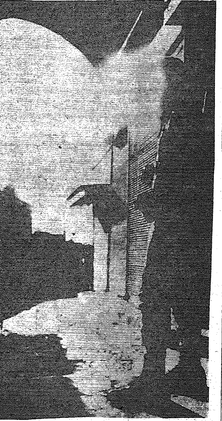
باب العمود في القدس وقد خسلان المرواد بسبب فرض منع التجول مساء يوم حادث الانفجار